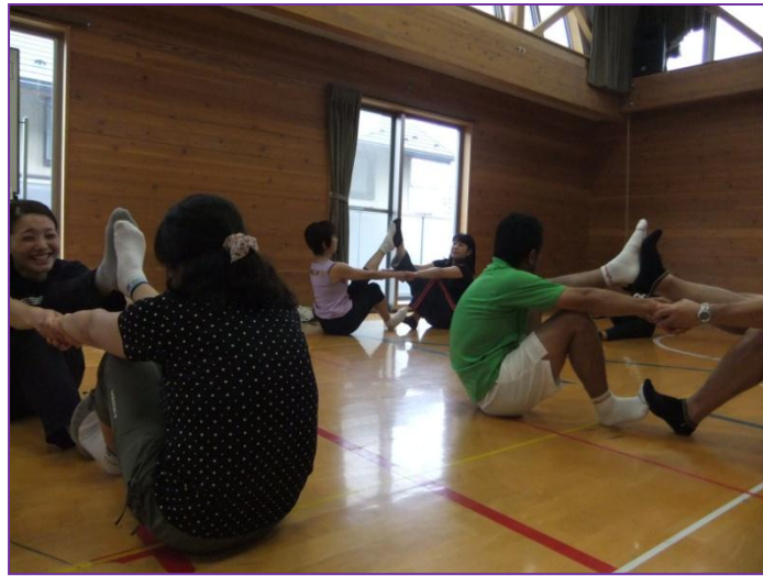
最後は、二人組でストレッチ