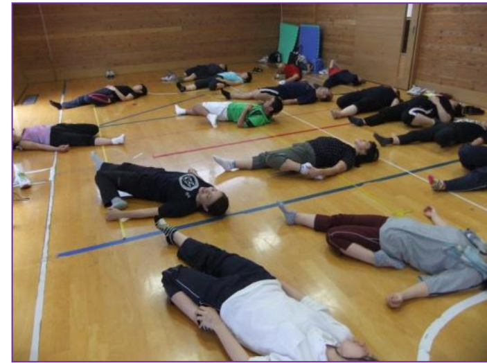
体も心もクールダウン